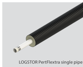
LOGSTOR PertFlextra single pipe

Dimension du tube de service 25 – 63 mm et dimensions de l'enveloppe extérieur 90 – 180 mm.