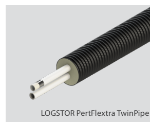
LOGSTOR PertFlextra TwinPipe